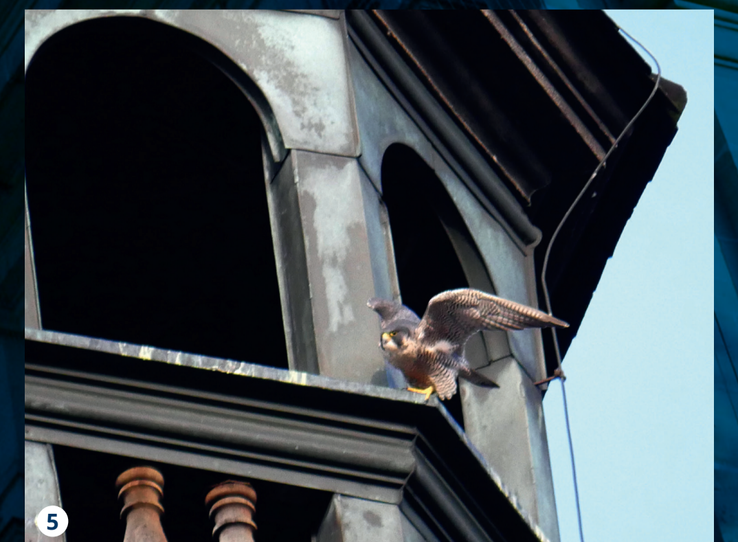
Auswahl an verschiedenen Gebäudebrüterarten, die in Erlangen vorkommen: Storch, Mauersegler, Mehlschwalbe, Wanderfalke.